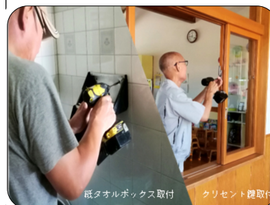
低圧オルボックス取付